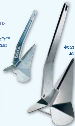
Ancora Delta™ in acciaio inox